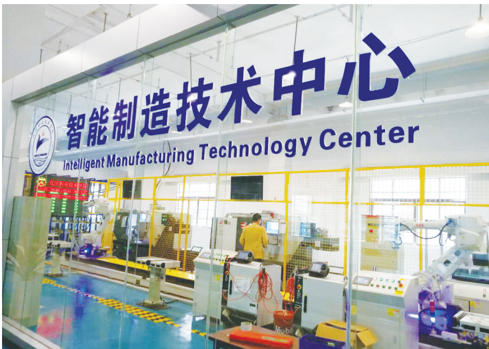
九江新兴产业双创示范基地智能中心。