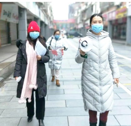
党员干部走街串巷进行疫情防控

电子屏滚动播放宣传知识,并让社区工作人员加入各个小区微信群,定期发放疫情防控知识来扩大宣传,确保宣传工作无死角、全覆盖。同时,通过加大对辖区低保人员和弱势群体救助,定期为他们购买蔬菜、米、油等生活用品,保障低保人员和弱势群体的正常生活。