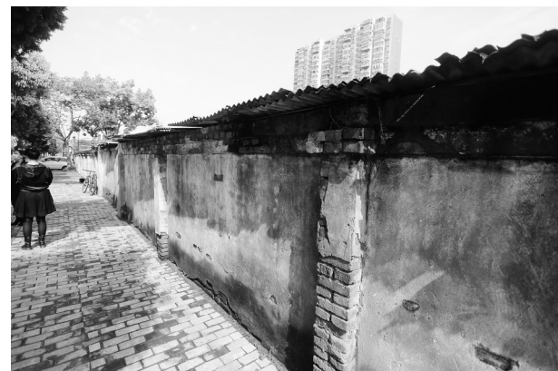
经开区西苑西路即将改造。