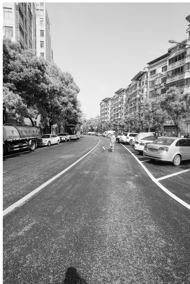
改造后的经开区内环路干净整洁、宽敞大气。