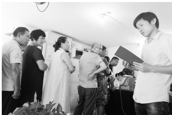
B区业主正在领不动产权证。

金丰·御园位于九江经济技术开发区出口加工区对面。2018年,小区部分业主办理了不动产权证,但仍有一部分没能办理。在等待两年后,这些业主不免着急上火。今年9月,小区B区的业主开始领取不动产权证,但C区的依旧没有,这又是什么原因呢?记者为此进行了调查。