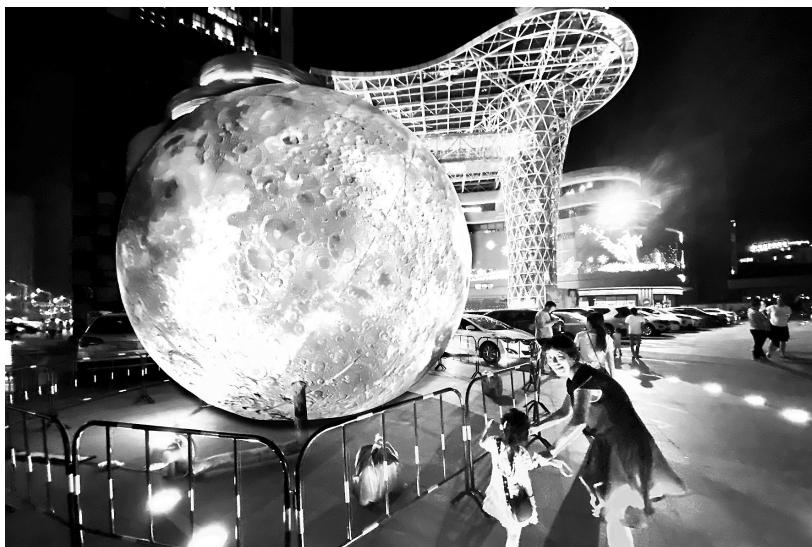
9月19日晚,我市街头巷尾中秋氛围浓郁,市区某商场以中秋元素进行造景,弘扬我国优秀传统文化,引来许多市民前来游玩、拍照。