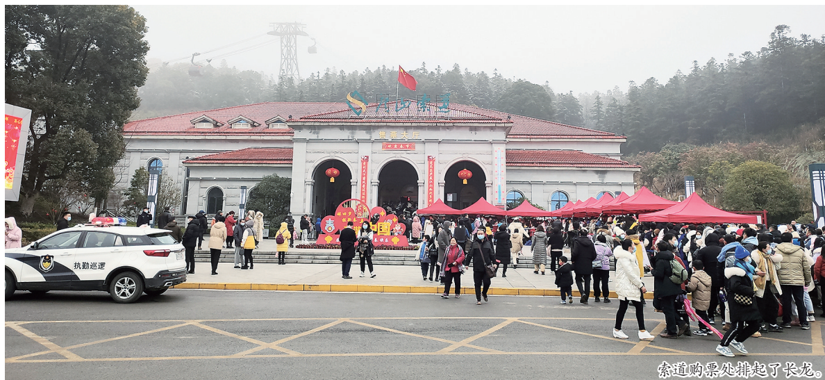
索道购票处排起了长龙。

本报讯(胡晓山 记者 陈诚 文/摄)元宵节后,春节收官,庐山交通索道各项指标创历史最好水平。据了解,春节15天,庐山交通索道接待游客30万人次,购票人次近16万人次,收入近1200万元,各项营收指标均超历史同期,创2017年开业以来单月新高。