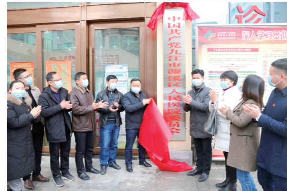
医院党总支升格为党委

2021年,院党总支升格为党委。进一步加强党的政治思想建设,贯彻落实意识形态工作责任制,推进“双培优”工程,加强干部队伍建设。扎实开展党史学习教育,引导党员干部学史明理、学史增信、学史崇德、学史力行。开展“我为群众办实事”主题实践。进一步加强党风廉政建设和医德医风建设,建立健全党风廉政建设与医德医风建设管理体系。进一步落实领导干部参加双重民主生活会制度,提高领导干部民主生活会质量。开展党风廉政教育,引导党员和群众自觉抵制不良倾向。