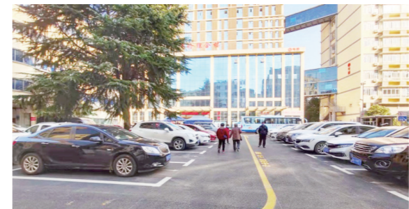
在确保正常医疗秩序的前提下,圆满完成医院院地地面“白改黑”工程。

金牛昂首高歌去,玉虎迎春敛福来。2022年,全体濂溪人将继续秉承“敬佑生命、救死扶伤、甘于奉献、大爱无疆”的医者精神,豪情满怀、步履坚定、志在未来,以只争朝夕、不负韶华新时代精神,坚定不移致力于医院“十四五”高质量发展的壮美蓝图再添新彩、再立新功,以优异的成绩迎接党的二十大胜利召开。