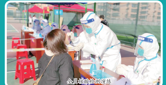
全员核酸检测演练