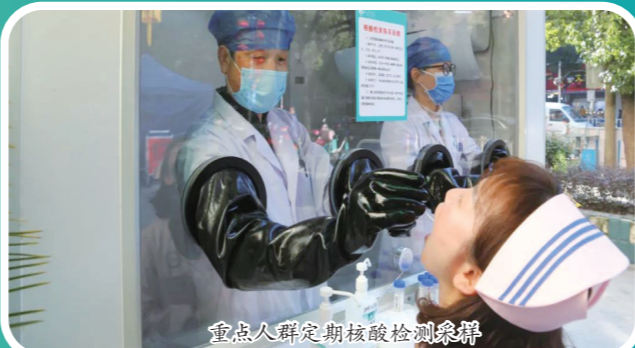
重点人群定期核酸检测采样