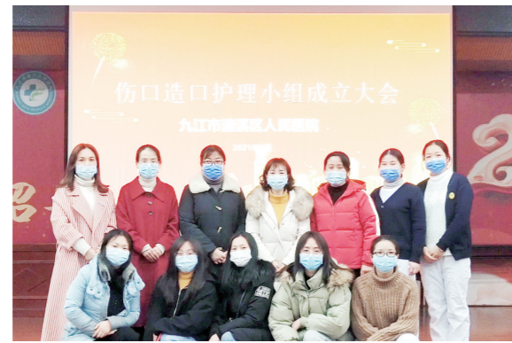
“伤口造口”专科小组成立

修订医疗质量与安全指标,持续对医疗18项核心制度的执行情况进行督查。夯实临床路径及单病种管理,加强医疗技术准入管理。开展规范医疗行为专项整治行动,对合理检查、合理用药、合理治疗等方面进行常态化专项检查。持续加强病案管理,入选为国家病案管理质量监测哨点医院,为全省唯一的一家二级公立医院。修订护理质量管理目标,实行院科两级护理质量管理。深化优质护理服务内涵,完善护理绩效方案,提高护理人员工作积极性。成立护理急救小组和伤口造口护理小组,提高全院护士急救能力,规范全院造口护理、压力性损伤护理。