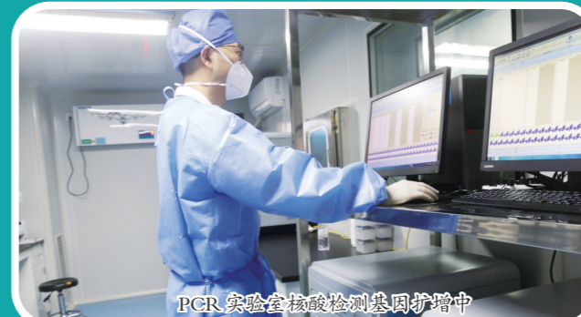
PCR实验室核酸检测基因扩增中