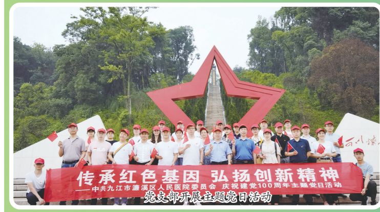
传承红色基因 弘扬创新精神 ——中共九江市濂溪区人民医院委员会 庆祝建党100周年主题党日启动