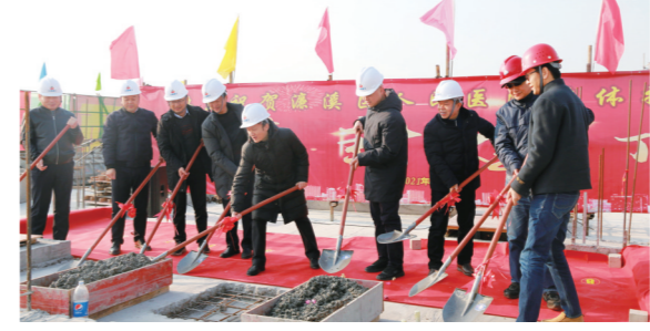
医院整体搬迁工程住院楼封顶仪式

占地140亩、建筑面积8.6万平方米、设置床位800张的新院区建设项目顺利推进,现已完成住院楼、感染楼、体检楼和学术报告厅的封顶。进一步完善消防设施,开展消防安全知识讲座培训及灭火应急疏散演练。安装智能热成像安检门。通过国家四级电子病历评级。上线用药前置审方系统和病案管理系统。启用核酸预约检测系统,助力疫情防控。建党百年网络安全“护网行动”成绩优异。落实国家医保政策改革,上线国家医保接口,并代表二级医院接受省里在线的贯标验收,受到好评。增设雨棚,方便了患者及职工车辆遮阳避雨。完成院区道路白改黑工程,彻底解决院区道路破损问题。