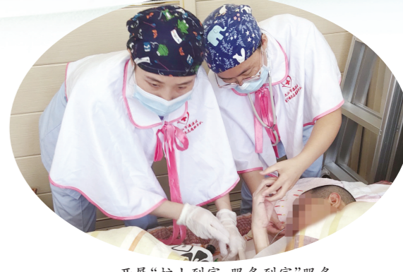
开展“护士到家,服务到家”服务

金牛昂首高歌去,玉虎迎春敛福来。2022年,全体濂溪人将继续秉承“敬佑生命、救死扶伤、甘于奉献、大爱无疆”的医者精神,豪情满怀、步履坚定、志在未来,以只争朝夕、不负韶华新时代精神,坚定不移致力于医院“十四五”高质量发展的壮美蓝图再添新彩、再立新功,以优异的成绩迎接党的二十大胜利召开。