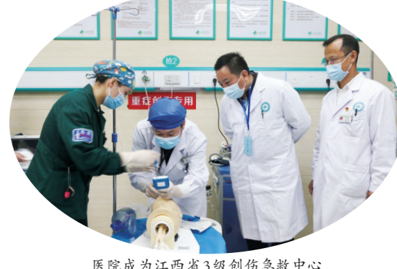
医院成为江西省3级创伤急救中心