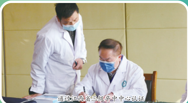
通过江西省三级卒中中心认证