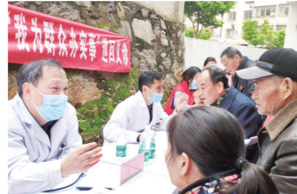
开展“我为群众办实事”各类主题义诊

夯实志愿服务工作,“健康濂溪·急救科普‘五进’”志愿服务项目被评为“2021年度江西省示范性重点志愿服务项目”。成立了濂溪区南丁格尔志愿服务队,开展义诊、健康讲座、急救知识培训、走访慰问、上门服务等活动,按照公共卫生服务“六进”要求,先后深入社区、乡镇、敬老院等开展形式多样的健康教育活动。