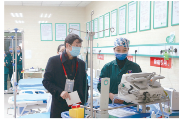
胸痛中心创建通过省级联盟预检

全年开展新技术新项目29例,加大肿瘤MDT管理力度,确保肿瘤MDT诊疗规范开展。充分利用对口支援政策开展新技术,全力推进“创伤急救、卒中、胸痛”三大中心建设,提高危重疾病的救治效率和水平,通过多学科协作与无缝对接,保障了伤者在短时间内得到更快捷、更规范的治疗。省专家组对医院创伤急救中心建设、卒中中心建设、胸痛中心建设进行现场核查,均通过省级核查,目前胸痛中心等待国家级胸痛中心验收。