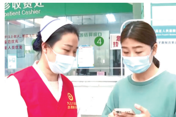
2021年4月20日,正式上线电子发票系统,开出了九江市第一张医疗电子发票。

医院先后开展通过合理用药系统开设微信用药咨询端口,审方药师为患者提供用药咨询服务。上线医疗电子发票系统,实现了门诊、住院统一使用电子发票,优化了门诊的流程,便捷了患者就诊。实行一类、二类慢性病一站式办理慢病卡。落实县域内外伤网络直审,解决群众报销来回跑的问题。积极落实健康扶贫相关政策,全面执行贫困人员“先看病后付费”“一站式医疗费用结算”“住院个人报销比例控制在90%适度范围”“贫困人员25种重大疾病专项救治”。