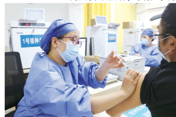
全面启动新冠疫苗加强针接种工作

规范发热门诊设置,配置专门CT、检验室及售药专柜,顺利通过发热门诊再次验收。出动200余人次,全力做好各乡镇卫生院预防接种门诊的新冠疫苗接种医疗保障任务。预防接种门诊完成新冠疫苗接种148517剂次,其中第一针67519剂次,第二针70170剂次,第三针10828剂次。制定核酸采样检测方案,高质量完成核酸检测。严格落实“四查一戴”政策,上报带*号行程码登记共1566人。参与区疫情防控指挥部组织的4次集中核酸实战演练,三次实战演练共采样9003人次。安全完成境外返濂、中高风险地区返濂人员的转运共计1431人次,1038趟,车辆行驶超10万公里。