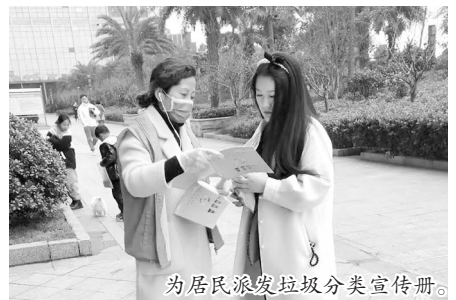
为居民派发垃圾分类宣传册。

本报讯(石心慈 记者 吕安琳 文/摄)为进一步推进垃圾分类工作,近日,经开区七里湖街道沿河社区组织垃圾分类督导员到辖区各小区进行垃圾分类宣传。