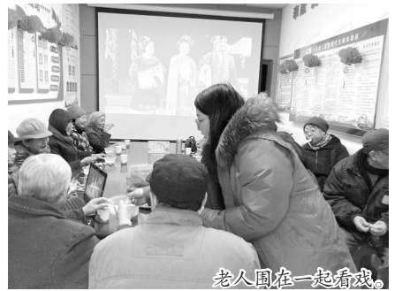
老人围在一起看戏。

本报讯(记者 吴业园 文/摄)“树上的鸟儿成双对,绿水青山带笑颜……”2月24日,在经开区一马路社区传来锣鼓和悦耳动听的黄梅戏声,社区老人看得不亦乐乎。