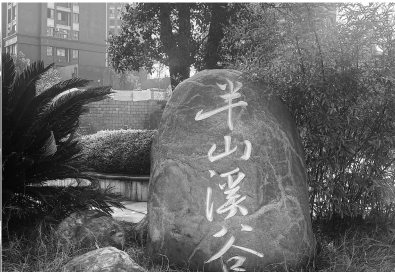
半山溪谷小区门口。

本报讯(实习生 夏恒心 查宣彤 记者 吴业园 文/摄)一手交钱,一手签订合同,原本以为开发商会按期交房,可是业主却愿望落空。近日,位于九园路半山溪谷楼盘开发商遭到部分业主投诉,称开发商原本承诺2020年交房,至今未交付给业主使用,大家担忧购买的房子会“烂尾”。