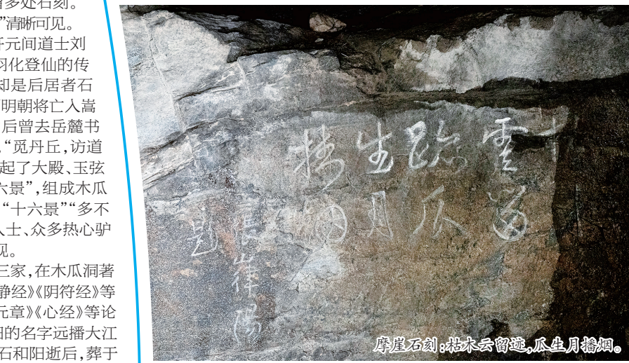
摩崖石刻:枯木云留迹,瓜生月播烟。