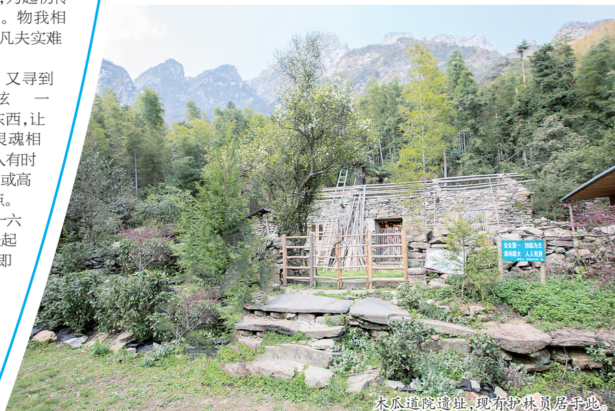
木瓜道院遗址,现有护林员居于此。