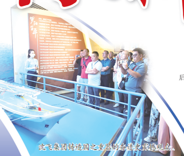
沈飞集团铸造国之重器的航空史展馆。