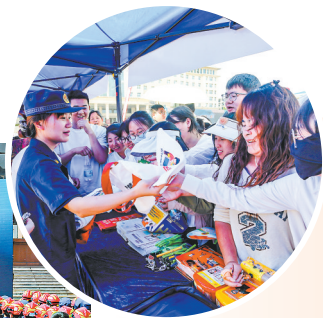
5月10日,2026九江市“全国防灾减灾日暨防灾减灾宣传周”主场活动在湖口县举行。