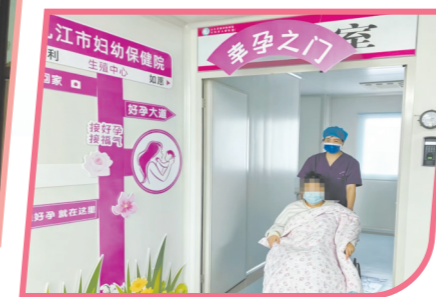
精心打造“幸孕之门”与“好孕大道”拍照打卡点。

生殖中心的患者群体比较特殊,她们往往背负着巨大的心理压力。为此,科室倾力打造“生命为始,筑梦为愿,护爱为责,理蕴人文”的品牌,构建了从门诊到手术、从院内到居家的全周期人文服务体系。