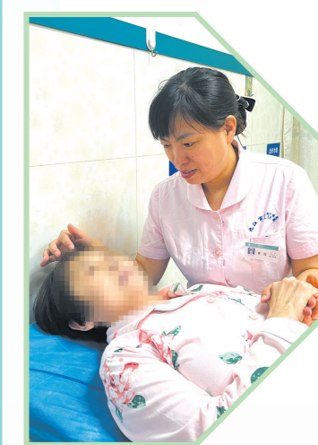
清宫时紧握患者的手轻声安抚。