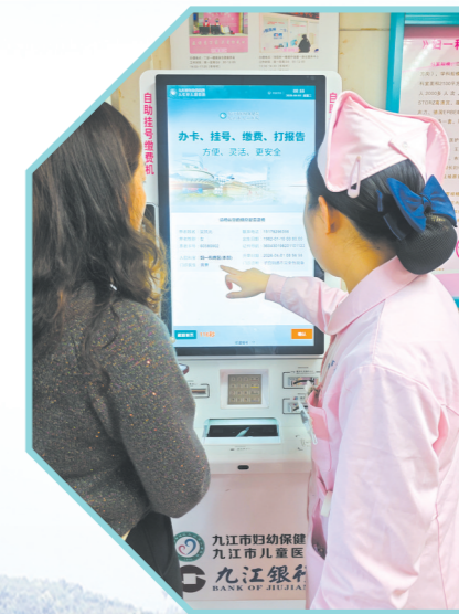
全面推行自助一键入院。

面对患者术前的恐惧,科室用“同伴教育”代替单向说教。那些反复翻看宣教手册却依然眉头紧锁的患者,在康复者真实的讲述中,慢慢疏解了对未知的紧张。盆底防治中心举办医患联谊,邀请处于不同康复阶段的新老朋友回到医院,共同分享康复历程,把一个人的艰难跋涉变成了一群人的彼此照亮。