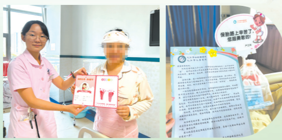
足印纪念卡为新生儿留下珍贵印记。

家长发来的微信感谢、出院时送来的蛋糕、12345政务热线转来的表扬工单——这些真诚的认可,是对“有温度护理”最好的回响。