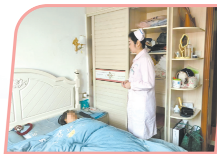
护士提供上门服务。