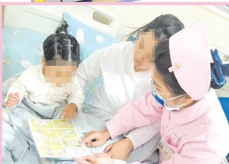
卡通版宣教卡让健康教育可亲可懂。

走进西院儿科,首先映入眼帘的是充满童趣的墙面贴纸、摆满玩具和绘本的书架、写满心愿的互动板。这里不仅是治疗场所,更像一个精心设计的儿童乐园。