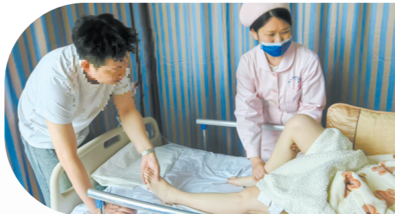
手把手教准爸爸给准妈妈按摩腿部。

这里的关怀充满仪式感。住院期间赶上生日,会收获一场“床旁生日”,祝福与花束送到床前;新年宝宝降生,有护士亲手编织的玩偶陪伴;每一个新生儿,都被赠予一张由责任护士现场按压的足印纪念卡,留下人生的第一份珍贵印记。