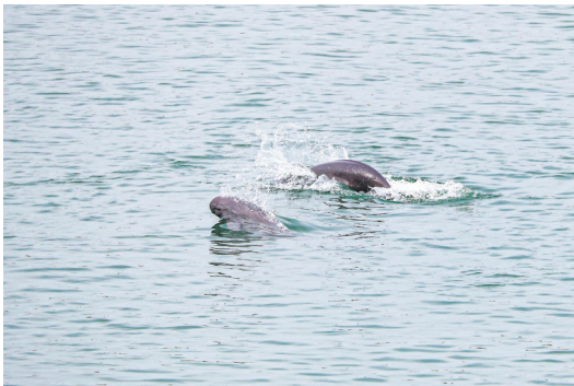
5月10日,长江江豚在湖北省宜昌市葛洲坝下游逐浪嬉戏。

近日,葛洲坝下游附近出现成群的长江江豚,它们时而结伴潜水,时而跃出水面。有“微笑天使”之称的长江江豚是长江水生生物保护的旗舰物种,也是目前长江中唯一的淡水鲸豚类动物。